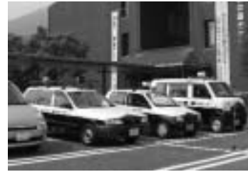
青色回転灯パトロール車 発進 (平成18年8月11日)