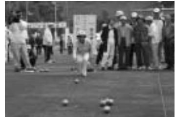
ねんりんピックベタンク交流大会 (平成18年10月29・30日)