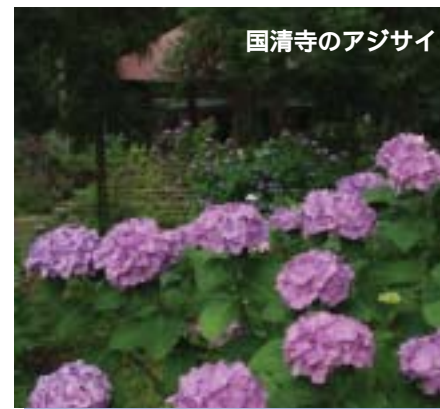
国清寺のアジサイ