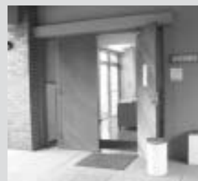
靴を脱いでどうぞ。室内には授乳室もあり

六月は雨の多い季節。せっかく親子が一緒に休日も、雨が降ってはどこにも遊びに行けない...。そんなときは、葦山時代劇場内・葦山図書館にある、幼児図書室に足を運んでみてはいかがでしょうか。 図書館西側の約十一畳の小部屋に靴を脱いで入ると、童話や昔話、アンパンマンなど約千点の紙芝居が、対象年齢別に揃えてあり、紙芝居をする机といすが置いてあります。ここは、訪れた人が、自分で紙芝居できる部屋なのです。 普段の絵本とはひと味違った紙芝居に、子どもたち