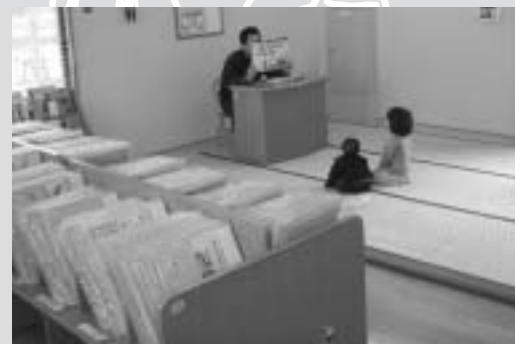
紙芝居スペースは約6畳。蔵書は約1,000点

六月は雨の多い季節。せっかく親子が一緒に休日も、雨が降ってはどこにも遊びに行けない...。そんなときは、葦山時代劇場内・葦山図書館にある、幼児図書室に足を運んでみてはいかがでしょうか。 図書館西側の約十一畳の小部屋に靴を脱いで入ると、童話や昔話、アンパンマンなど約千点の紙芝居が、対象年齢別に揃えてあり、紙芝居をする机といすが置いてあります。ここは、訪れた人が、自分で紙芝居できる部屋なのです。 普段の絵本とはひと味違った紙芝居に、子どもたち