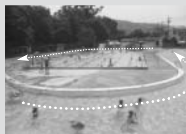
ご存じ『流水プール』。一周135メートルを浮き輪に乗って漂流しよう。

いよいよ夏が来ます。子どもたちが夏休みに入ると仕事が終わりの日は、海につれてつて!!とせがまれることでしょうか。しかし、海は遠い、道は渋滞、お金がかかると悩みはつきません。 そこで、近くで、安くて、子どもと一緒に水遊びできる、しかも『流れる』プールがある、広瀬公園水泳プールはいかがでしょう?