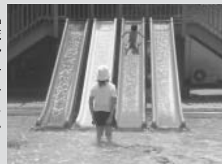
これが『流れるすべり台』。幼児プールは水深50センチ以下なのでパパも安心

いよいよ夏が来ます。子どもたちが夏休みに入ると仕事が終わりの日は、海につれてつて!!とせがまれることでしょうか。しかし、海は遠い、道は渋滞、お金がかかると悩みはつきません。 そこで、近くで、安くて、子どもと一緒に水遊びできる、しかも『流れる』プールがある、広瀬公園水泳プールはいかがでしょう?