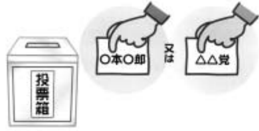
候補者氏名または政党名を記載して投票