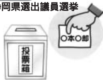
候補者氏名を記載して投票