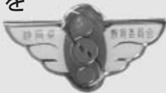
実行章(ピンバッジ)

県では、『地域の青少年声掛け運動』を啓発中です。この運動に参加登録してくれた人には写真の実行章が県から配布されます。『朝のあいさつ声掛け運動』や地域での声掛け運動の際にもこの実行章を付けていただきたいと思います。皆さんもぜひ登録をお願いします。登録方法については各小中学校、幼稚園、各地域の青少年育成会または教育委員会までお問い合わせください。