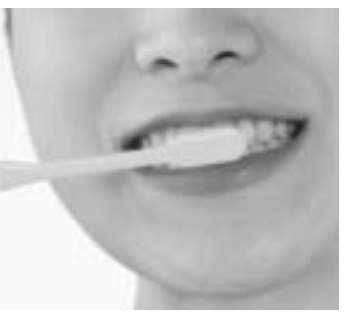
1日3回5分のブラッシングを

歯周病は歯ぐきの腫れや出血を起し、進行すると歯が抜け落ちてしまう病気です。その原因は、歯垢や歯石など、口の中の汚れです。歯周病の一番の問題は、自覚症状が少ない事です。そのため、気づいた時には手遅れとなることも少なくありません。では、どうしたらよいのでしょうか? 予防法は二つあります。まず、一つはブラークコントロール、毎日のブラッシングです。歯と歯ぐきの境目によくブラシをあて、一日三回、五分以上の歯ブラシを心がけてください。