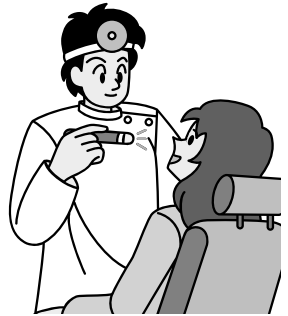
定期的なクリーニングを

てください。テレビを見ながらなど、時間をかけても苦にならない環境を作りましょう。