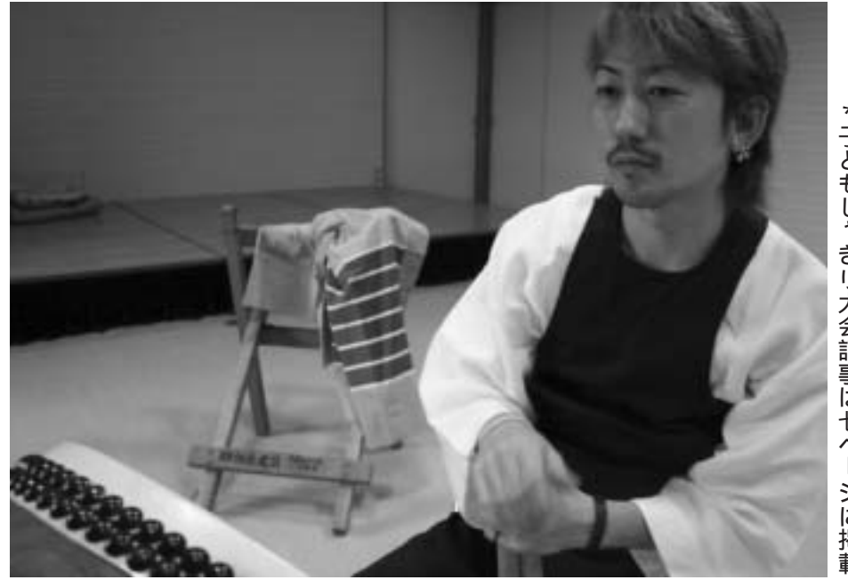
*子どもしゃぎり大会記事は七ページに掲載

問合せ 伊豆の国市歯周病予防対策委員会事務局(健康づくり課) 電話 0558(76)8014