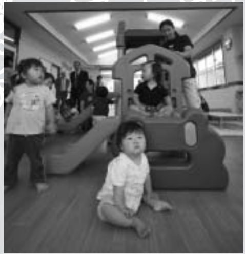
楽しい遊具がいっぱいのプレイルーム

訪れると、まず最初に親子ともに名札をつけてもらいます。この名札で、利用者同士の名前が分かるので、子どもたちだけでなく、パパやママ同士も友だちになれるのです。