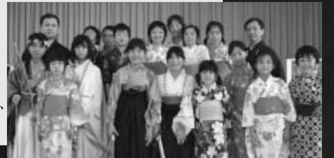
「わたしたちの晴舞台を、ぜひ見に来てください」