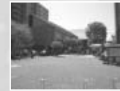
アクシスかつらぎ

社会教育課から往復はがきを送付しますので、お手数ですが再度返信用はがきを返信してください。 *参加申し込みをしない人は、記念品が無い場合がありますのでご了承ください。