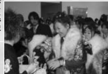
昨年の式典の様子

市内在住の人は教育委員会社会教育課から十月中旬に往復はがきを送付します。必要事項を記入の上、十一月二十六日(月)までに返信してください。