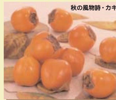
秋の風物詩・カキ

伊豆の国市の秋の名産と言え ば、カキ。天野が特に有名です が、宗光寺や白山堂などでも栽 培されています。干し柿にする 『四ッ溝』や、やわらかく甘みの 多い『富有』、固めでシャキシャ キとした食感が魅力の『次郎』な ど、種類も豊富です。 また、カキは栄養価も高く、 甘柿はビタミンCや血圧を下げる 働きのあるカリウムを、干し 柿は風邪の予防に役立つ『カロ テン』を多く含みます。 市内産のカキは、『大仁まご ころ市場』や『グリーンプラザ伊 豆の国』、市内スーパー・八百屋 などでお求めください。