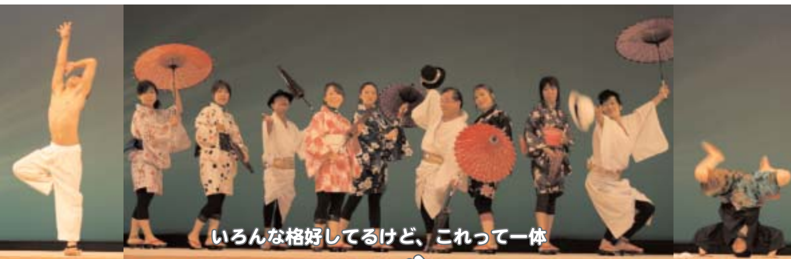
いろんな格好してるけど、これって一体