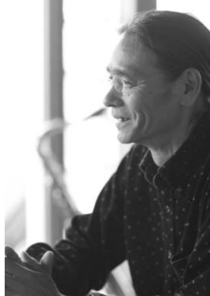
* 11 / 23(金)・24(土) 葦山時代劇場ジャズフェスティバル、チケット好評発売中。問い合わせは、文化振興課(電話 055 949 8600)まで。