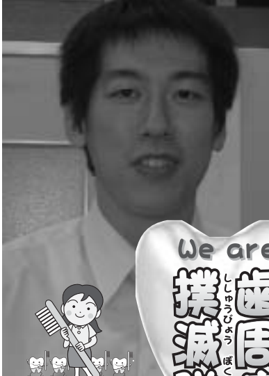
その6 歯周病経験者に聞く