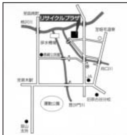
葦山リサイクルプラザ 電話 055 949 5755