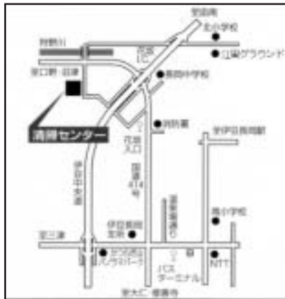
長岡清掃センター 電話 055 948 2536