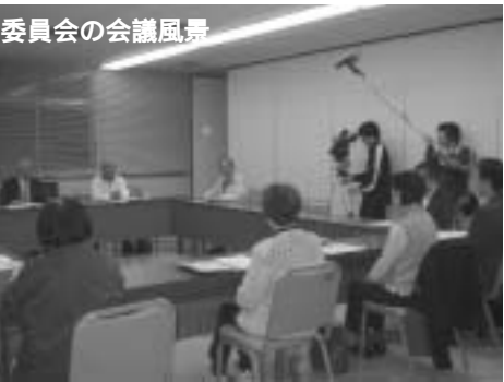
委員会の会議風景