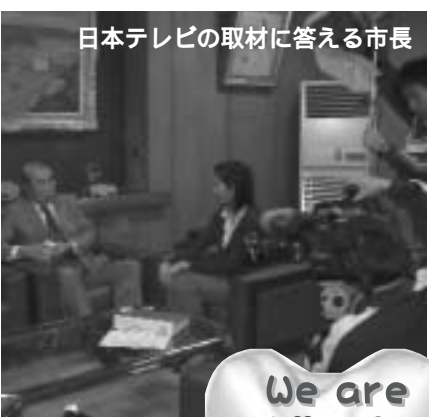
日本テレビの取材に答える市長

十一月五日、歯周病予防対策委員会が日本テレビの取材を受けました。内容は市長へのインタビュー、委員会の様子、会長へのインタビュー等。歯周病予防に関する市の委員会設置条例策定や、市民参加型の委員会活動は、全国の先駆けであり、なぜ条例化したのか?というインタビューに、「歯周病の怖さを皆に知ってもらいたい、歯の大切さを皆に知ってもらいたい」と市長がコメントしました。委員会では、普及活動として予定していた『ふれあい広場 健康福祉まつり』が雨天により中止となったので、今後の普及活動をどのように展開していけばよいかという会議が開かれました。また会長へのインタビューでは、歯周病予防対策委員会の活動や委員の構成などにつ