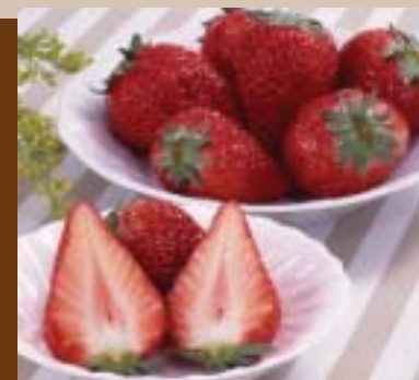
紅ほっぺは「大人」の味

いよいよ待ちに待ったイチゴの季節。イチゴ狩り園十六ページ記事や、いちごまつり(五ページ)など、この時期はイチゴのイベントが目白押し。スーパーや八百屋、大仁まごころ市場にも市内産イチゴが並びます。イチゴは、豊富なビタミンCや抗酸化物質(ポリフェノール)の一種「アントシアニン」も含まれており、体に良い果物。現在、JA伊豆の国管内で百パーセント近い市場出荷率を誇る品種は「紅ほっぺ」。『紅ほっぺ』の特徴は大粒で鮮やかな濃紅色、味は甘みだけでなく程良い酸っぱさを合わせ持つ、まさに「大人」指向の本格派イチゴです。