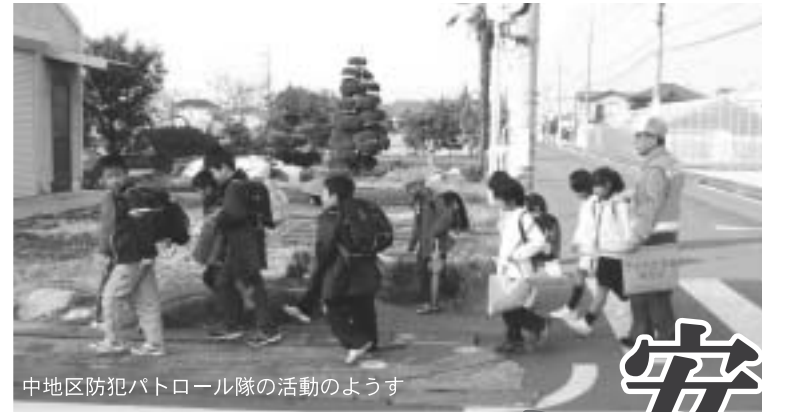
中地区防犯パトロール隊の活動の様子

防犯や交通安全団体の代表者などがパレードします。パレードの先頭では、寿光幼稚園と楽生保育園の園児の皆さんによる演奏が行われます。交通規制の関係上、パレードへの参加は事前にご案内させていただいた方のみとさせていただきますので、その他の方は、沿道での観覧をお願いします。