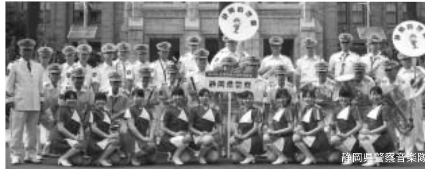
静岡県警察音楽隊