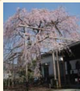
シダレザクラ(昨年3月28日撮影)

申込み 秘書広報課 電話055 948 1431 info@city.izunokuni.shizuoka.jp