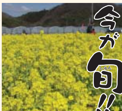
菜の花(昨年2月末撮影)

色とりどりの花が咲き始めると、春の訪れを感じます。長岡、江間、葦山各いちご狩りセンター周辺の畑には、四月上旬まで、菜の花が咲き続けます。畑一面の鮮やかな黄色は、長い期間、人を吸い寄せる力があります。一方で、三月下旬に満開を迎え四月には散ってしまう「龍源院(三福公民館南東側)のシダレザクラ」の短命さにも、はかない花の魅力を感じてしまいます。長くきれいで、短く美しい...あなたはどちらの春がお好みですか?