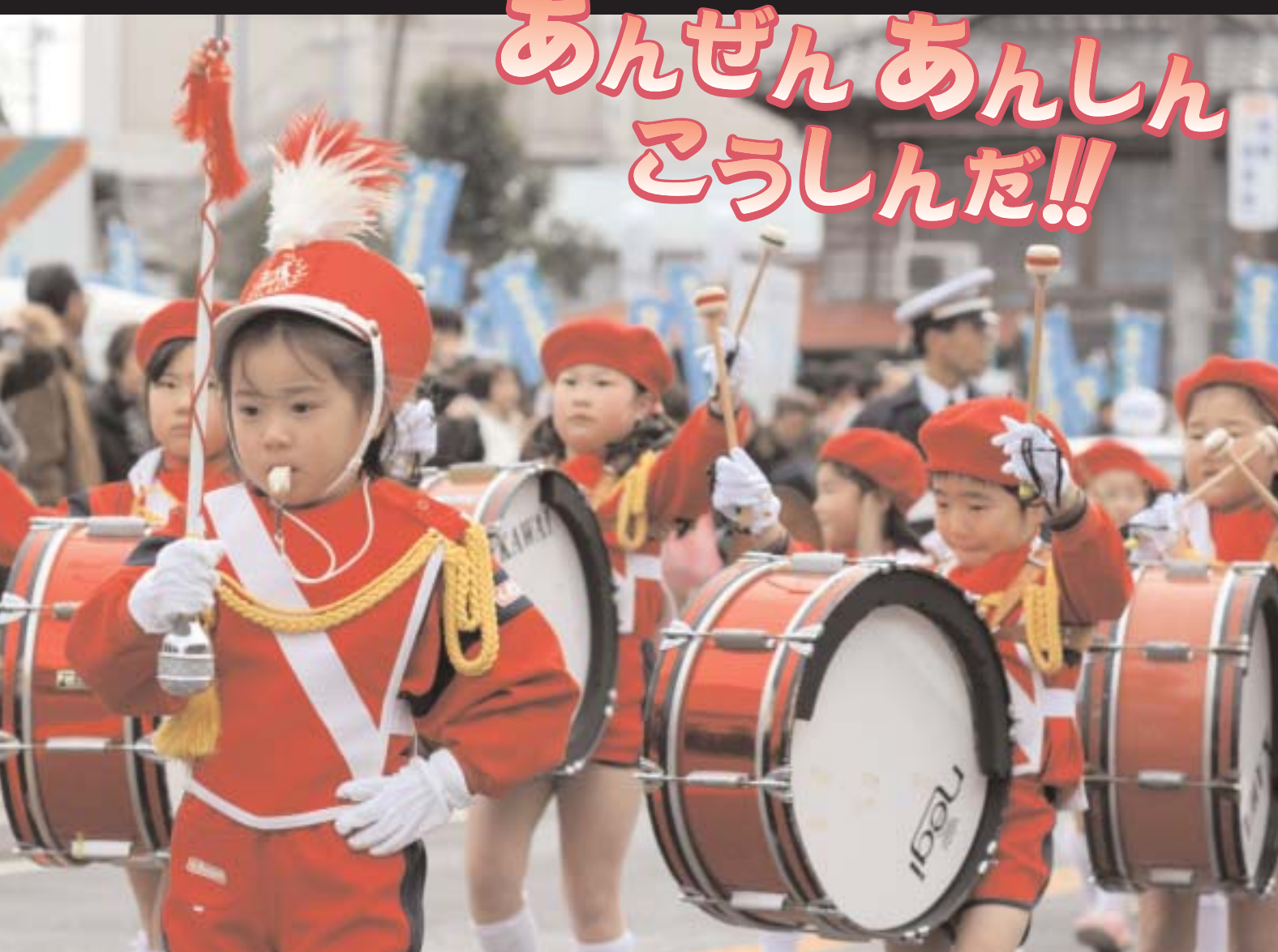
伊豆の国市 安全で安心なまちづくり推進大会 開催