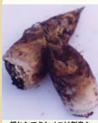
採れたてタケノコは刺身も

四月の旬の味といえばタケノコ(筍)。竹はとても成長が早く、タケノコとしておいしく食べられるのは短い間。このことから漢字の筍は、十日間を意味する『旬』に由来していると言います。田中山や浮橋、長者原などの山間地の竹林で採れるのは、モウソウチクやマダケなど。この時期、大仁まごころ市場、JAGグリーンプラザには市内産の生タケノコや茹でタケノコが並びます。新鮮なタケノコを買って帰り、調理してみましょう。タケノコ料理は、煮物や炒め物、炊き込みご飯、みそ汁などが主流ですが、変わった食べ方としては焼き物、天ぷら、採れたてのものはなんと刺身にしてしょう油で食べることも。皆さんも一度試してみてください。