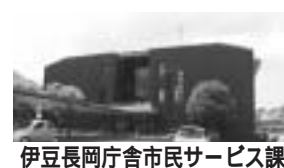
伊豆長岡庁舎市民サービス課