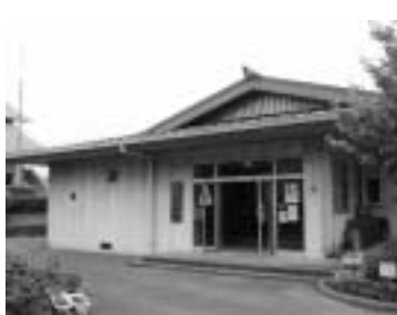
大仁児童館 (中央図書館・大仁市民会館の間)

幼児学級会員 未就園児とその親を対象とした学級です。親子と一緒に参加ください。 【活動】 月一回程度