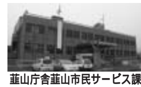
葦山庁舎葦山市民サービス課