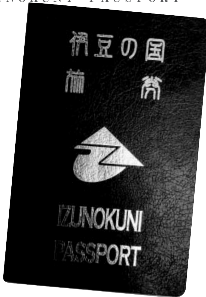
伊豆の国観光パスポート(ほぼ原寸) *海外渡航には使えませんのでご注意ください!

の皆さんに、「伊豆の国」を第二の故郷と 思ってもらえるよう に、おもてなしの心と、各種サービスを 提供し、市内観光交流人口を増やすこと。 もちろん、市内にお住まいの皆さんも、 このサービスをご利用になれます。 さあ、あなたも今すぐ、「伊豆の国観光 パスポート」を手に入れましょう。