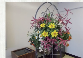
▲ハンギングバスケット