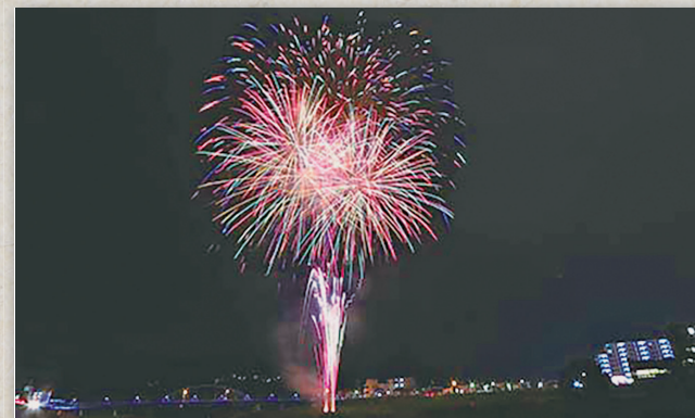
打ち上げられた花火