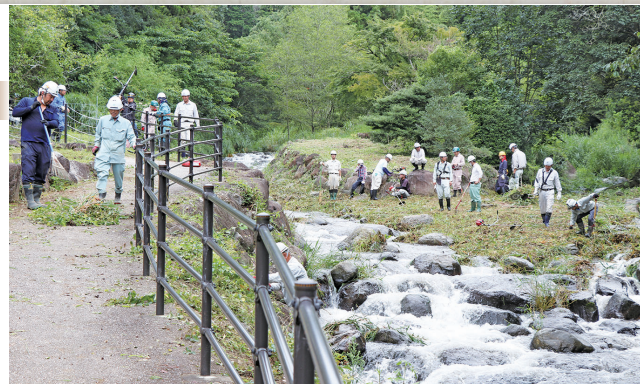
草刈りをする建設業協会の皆さん

この事業は、「葦山反射炉の日」に合わせ、平成27年度から毎年実施されており、今回で6回目の実施となりました。