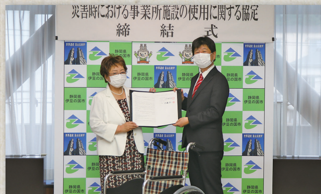
お披露目のテープカット