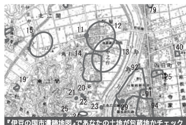
『伊豆の国市遺跡地図』であなたの土地が包蔵地がチェック

文化財保護法では、文化財は、「歴史や文化を理解するために欠くことのできない貴重な国民的財産」として定義されています。しかし、一口に『文化財』といっても、建造物や美術品から、史跡、天然記念物、演劇、音楽にいたるまでさまざまな種類があります。地下に埋まっている遺物や遺跡もそのひとつで、『埋蔵文化財』と呼ばれています。 市内にも、埋蔵文化財があると思われる場所(周知の埋蔵文化財包蔵地)が、多数存在します。それだけ歴史ある土地柄だということですが、包蔵地内で建築・工事などを行う場合には、注意しなければなりません。