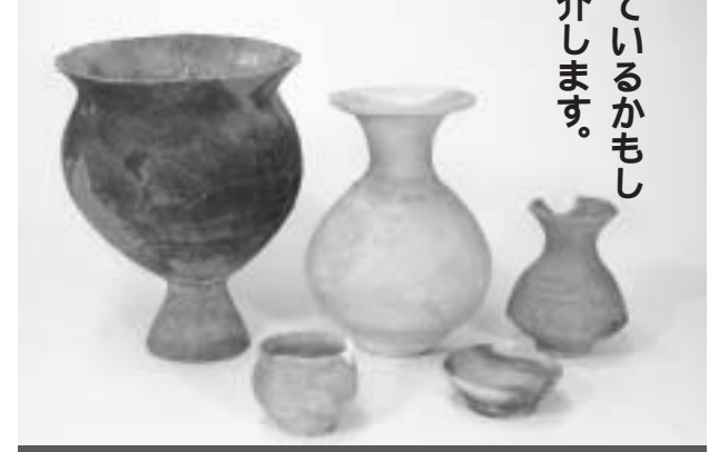
現在住宅地の山木遺跡からも、多くの土器が発掘された

近年、住宅等の建築や各種工事に伴って、遺跡(埋蔵文化財)を発掘調査するケースが増えています。 今回は、皆さんの土地に眠っているかもしれない埋蔵文化財への対応を紹介します。 建築や工事を 行うときには... 市内の土地で、建築や工事を計画する場合、その土地が、埋蔵文化財包蔵地内(遺跡)であるかどうかの確認が必要です。教育委員会・社会教育課(あやめ会館)には、『伊豆の国市遺跡地図』があり、いつでも見ることが出来ますので、ご相談の上、ご確認ください。