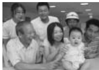
表紙のイメージ写真は、伊豆保健医療センター、田方消防本部、市職員の協力により撮影。赤ちゃんの存在で、モデルの皆さんも自然と笑顔になり、予想以上にスムーズな撮影ができました。撮影にご協力いただいた皆さん、ありがとうございました。

表紙は、田方広報研究会共同編集『つながる医療～地域の救急医療を知る～』のイメージ写真を、伊豆保健医療センター、田方消防本部、市職員の協力により撮影。赤ちゃんの存在で、モデルの皆さんも自然と笑顔になり、予想以上にスムーズな撮影ができました。撮影にご協力いただいた皆さん、ありがとうございました。