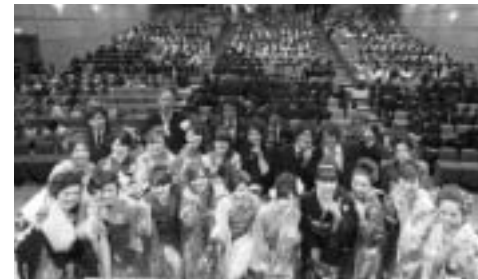
昨年の式典の様子