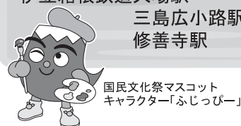
国民文化祭マスコット キャラクター「ふじっぴー」