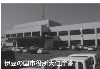
伊豆の国市役所大仁庁舎

確定申告会場では混雑が予想されることから、還付申告者を対象に事前説明会を行います。