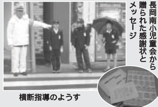
横断指導のようす

交通指導員会の皆さん、いつもありがとうございます。これからも、子どもたちを交通事故から守るため、よろしくお願いします。