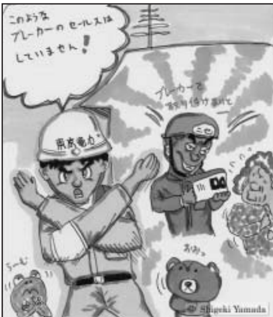
電力会社を装う業者が販売にきたときの連絡先 東京電力沼津カスタマーセンター 電話 0120 995 902

また、契約をしてしまった場合等にも、クーリングオフ等による救済方法が考えられます。被害に遭つた場合は、いち早く市役所等に相談しましょう。