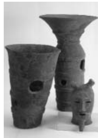
葦山運動公園造成時に発掘された多田大塚古墳出土埴輪

伊豆の国市遺跡地図(部分) で囲まれた範囲が埋蔵文化財包蔵地です。 *伊豆の国市遺跡地図は、市ホームページ内『遺跡の範囲内で工事を行う場合の届出について』 http://www.city.izunokuni.shizuoka.jp/syakai/bunkazai/kouji.jsp でもご覧いただけます。