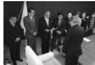
水道事業等経営審議会の答申

そこで昨年10月21日、伊豆の国市の水道料金について、市民の代表からなる伊豆の国市水道事業等経営審議会に市長が意見や提案を求めました。その後8回の審議会を開催して議論を重ね、今年3月30日、水道料金の統一についての答申が市長に提出されました(広報5月号14ページ記事)。