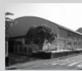
長岡南小学校 (長岡 1294 1)

参議院議員通常選挙 投票所の一部変更 7月に予定されている参議院議員通常選挙では、次の投票所が変更になります。