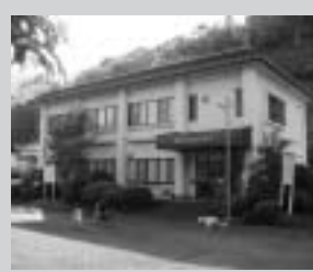
神島集会センター (神島橋左岸たもと)

お間違いのないよう、ご注意ください。 問合せ/市役所総務課 電話 055(948)1411