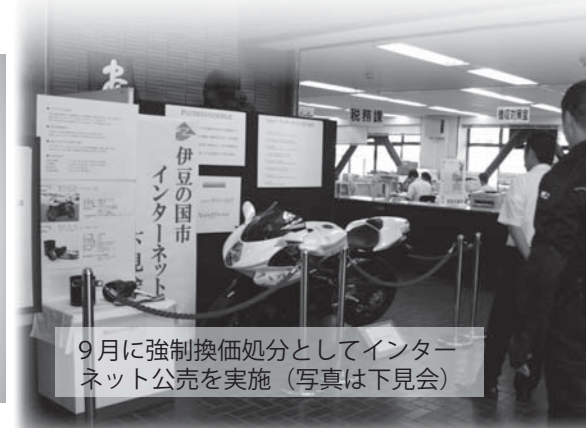
9月に強制換価処分としてインターネット公売を実施(写真は下見会)