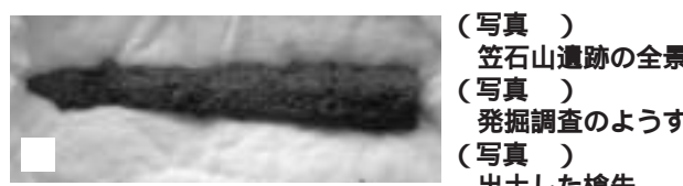
(写真) 笠石山遺跡の全景 (写真) 発掘調査の様子 (写真) 出土した槍先 (写真) 出土した管玉