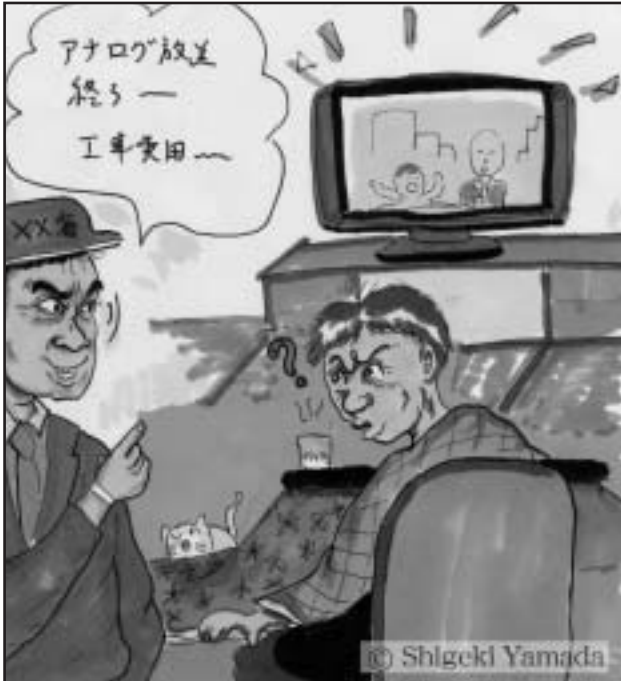
怪しいと思ったら、すぐにお金を払わずに相談を!

例えば、封筒を送りつけたり、消費者宅を訪問し たりして、「総務省に委託された」などと地デジ受信 料金や工事代金を請求します。消費者がこれら業者 に代金を支払ったものの、工事に着手することなく 連絡が途絶えたなどのケースが報告されています。 この詐欺は、高齢者世帯での被害が多いようです。 今後、地デジの放送開始に向けて、ますます増加 すると予想される「地デジ詐欺」。「あれ?怪しいな...」 と思ったら、すぐにお金を払わずに、家族や最寄り の警察、市役所に相談しましょう。