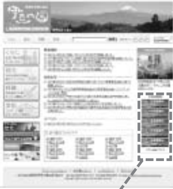
バナー広告欄(各期11枠まで)