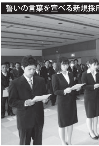
誓いの言葉を宣べる新規採用職員