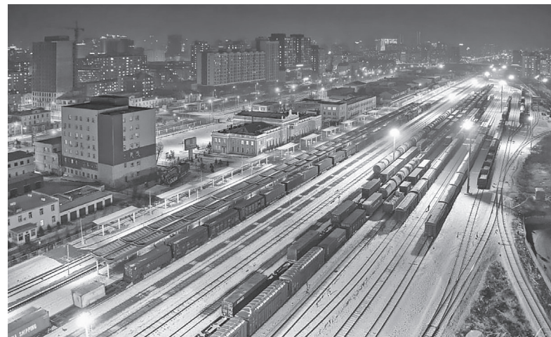
冬のウランバートル鉄道駅

さて、伊豆の国市の冬はイチゴやミカンのおいしい季節ですが、モンゴルの厳しい冬は野菜が育たず、秋に収穫し保存した野菜と輸入した果物しか手に入らないため、肉(羊、牛、馬肉など)を使った料理が多くなります。子どもの頃、短時間屋外に置いておくだけできた冷凍リンゴをトントン叩き、柔らかくして食べるのが好きだったことを思い出します。今はリンゴをカットして食卓に出すのが当た