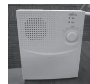
長岡地区での周波数を使用している個別受信機の一例