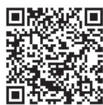
LINE 友だち追加用 QR コード

これに変わるものとして、伊豆の国市メール配信サービスやLINEの「伊豆の国市公式アカウント」から文章で情報を受け取れますので、ぜひ登録してご活用ください。(AM/FMラジオの聴取は12月1日以降も可能です。)