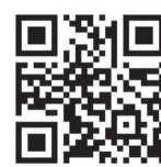
メール配信サービス登録用メールアドレス