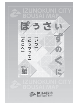
▲伊豆の国市防災マップ

伊豆の国市防災マップには、地震発生時の注意点や、家庭でできる防災対策、避難所の情報などが掲載されています。自宅や通学先、通勤先の周辺にある避難所を確認して、災害時に自分や家族がどのように行動すればいいのか考えてみましょう。