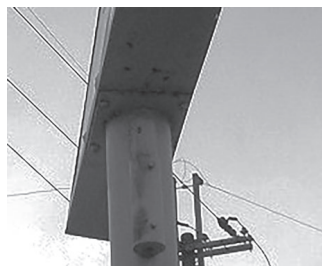
▲さび色の水が垂れたような跡(内部が腐食しているかも)