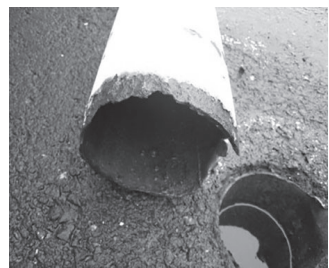
▲柱根元のさび(折れて倒壊するかも)