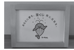
▲宝くじマスケットキャラクター クーちゃん