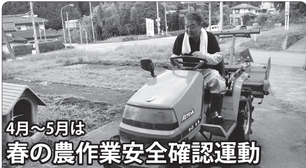
4月～5月は 春の農作業安全確認運動