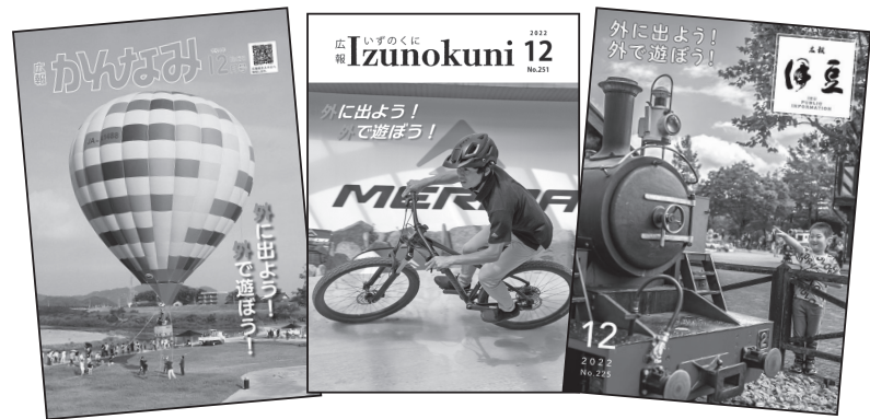
▲各市町の表紙 (左から函南町、伊豆の国市、伊豆市)