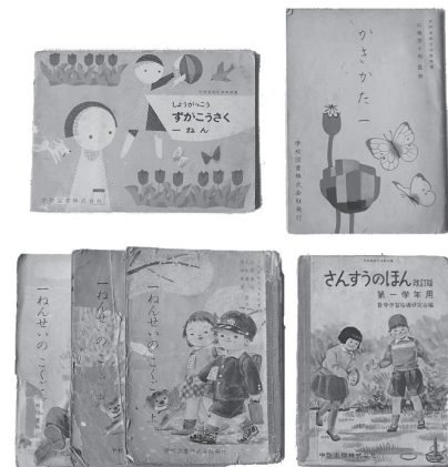
▲昭和25年頃の教科書

終戦から2年後の昭和22年(1947)、日本国憲法の施行に伴い学校教育法が施行されて新制小学校・中学校ができると、国定教科書は廃止され、再び教科書は検定制になります。そして現在、義務教育期間の教科書は教科書無償給与制度により、学生たちに無償で提供されています。 戦前の教科書は国語・算術・理科・日本歴史・地理・図画など現在と似たものがほとんどですが、現在はない科目の一例として、「修身」があります。これは、主に愛国や忠孝の精神を学習する道徳教育でした。第二次世界大戦頃まで教科に加えられていましたが、終戦直後に占領軍の指