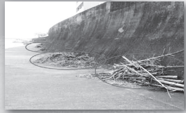
モニターから漂着物の報告