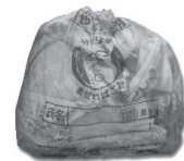
▲違反ごみ(氏名なし)

記入をお願いします。なお、ごみの分別方法については、広報1月号とともに配布した「ごみの分け方・出し方」パンフレットをご確認ください。分別の徹底によるごみ量の削減にご協力をお願いします。