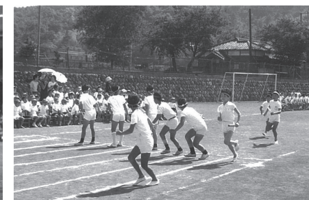
▲写真② リレー (伊豆の国市郷土資料館蔵)