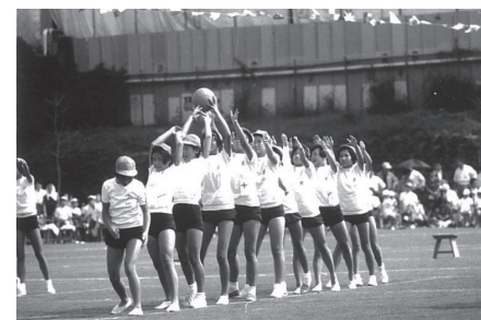
▲写真③ 順送球

また、「運動会」はさまざまな競技を行う学校行事で、そのルーツは明治7年(1874)に海軍兵学校で行われた「競闘遊戯」とされています。写真①は昭和2年(1927)の静岡県大仁高等学校の卒業アルバムに掲載された「体操」の写真です。広い運動場の中に、本塁、一塁から三塁が設けられ、守備の選手がいます。マウンドにいる投手は大きなボールを転がしているように見えます。これはキックベースボールのような競技でしょうか。