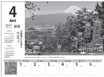
▲市民カレンダー写真掲載イメージ (変更する場合があります)