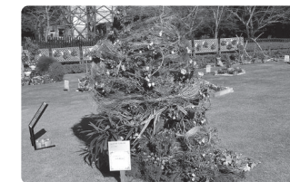
▲昨年度の金賞作品

制作期間／10月25日(土)9時～ ※雨天時は26日(日)に順延 花壇規格／1m×1mまたは1.5m×1m