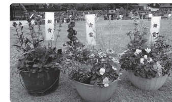
▲昨年度の受賞作品