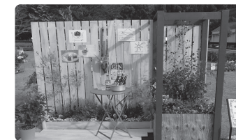
▲昨年度の金賞作品

定員／5団体(先着順) ※友人、地域団体などのグループでご参加ください。 その他／制作費用の助成があります。詳細は環境政策課へ問い合わせください。