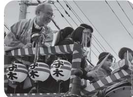
▲山車でしゃぎりをしている私

日本のお祭りは、伝統だけでなく、人々の温かい心と絆が生きている素晴らしい文化です。地域の皆さんの優しさに心から感謝しています。