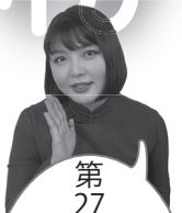
第27回地域のお祭り