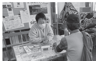
▲NPO法人 伊豆学研究会「出張相談会 in まちすけ」