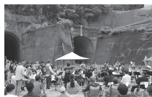
▲NPO法人 狩野川倶楽部「狩野川放水路60周年記念コンサート」