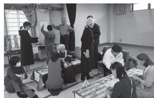
▲NAIZプロジェクト「みんなでクリスマス会」