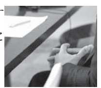
【1】実施機関別公文書の開示の利用状況 (単位:件)

「情報公開制度」は、市民の皆さんの知る権利を尊重し、市の諸活動に関する情報を公開することにより、皆さんの市政への理解と信頼を深め、開かれた市政を推進することを目的としています。