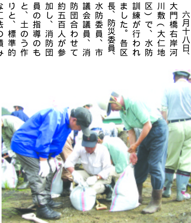
ビニール製の袋に砂を入れ、土のうを作る参加者

六月十八日、大門橋右岸河川敷（大仁地区）で、水防訓練が行われました。各区長、防災委員、水防委員、市議会議員、消防団員が参加し、消防団員の指導のもと、土のう作りと、標準的な工法の積み