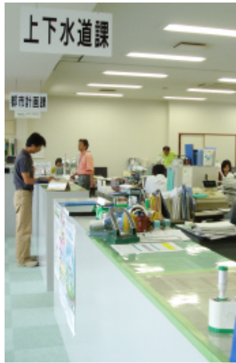
別館2階に移動した都市整備部

があやめ会館に、伊豆長岡庁舎にあった「都市整備部」が伊豆長岡庁舎別館へ移動しました。また、あやめ会館にあった各課もそれぞれに配置され、これにより、同じ部内の