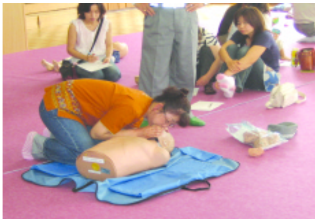
真剣な表情で訓練に取り組む母親たち

六月二十一日、長岡幼稚園家庭教育学級で、救急の基礎知識とAED（自動体外式除細動器）についての講習会が開かれました。長岡幼稚園の保護者五十七人が参加し、田方中消防署救急係員の指導のもと、心臓マッサージやAEDの使用方法を体験しました。